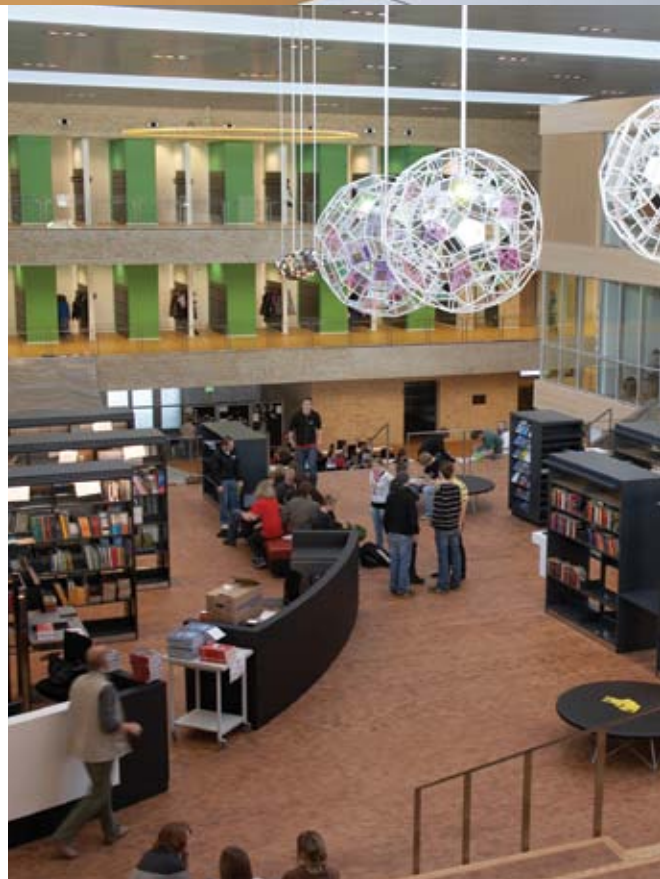
A.P. Møller skolen i Slesvig, er en skole for 7-10 årgang med en gymnasieoverbygning