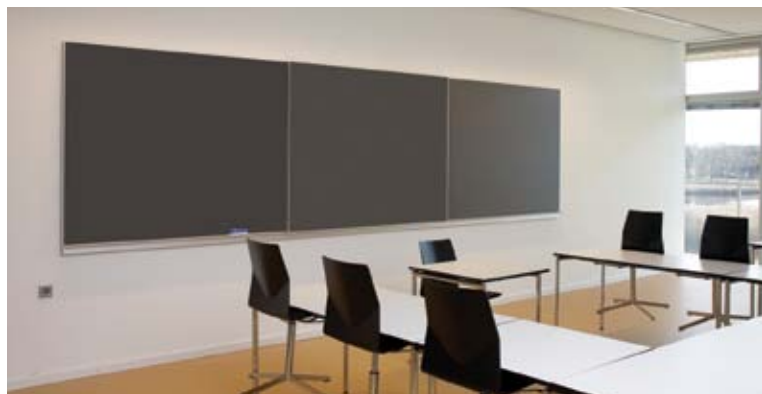
Dynamic løsningen her vist med skydetavlen kørt henover den interaktive whiteboardtavle

Alt dette er indbygget i Dynamic systemet der kan leveres både som whiteboard-/kridttavleløsning eller i en kombination.