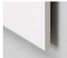
Kantafslutning uden ramme

På CBS er Vision konceptet gennemført i samtlige grupperum og mødelokaler, dette giver et godt sammenhæng med de øvrige materialer. Vision falder naturligt ind i det moderne undervisningsmiljø.