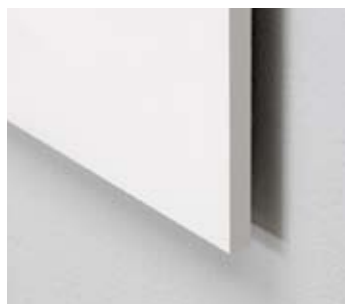
Vision står med ren kant

Ørestadens gymnasium er forsynet med vores Vision whiteboardtavler uden indramning i alle undervisningslokaler. Vision skrivetavlerne er udført som lange tavler, delt i 2 eller 3 moduler, hvor midterste sektion er forberedt som interaktive tavle. Vision falder naturligt ind i de åbne "luftige" lokaler.