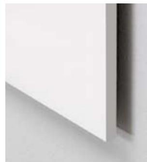
Vision whiteboard står med helt rene kanter

Politiskolen i Brøndby har gennemført Vision konceptet i samtlige undervisningslokaler og grupperum. Dette giver ensartethed og samtidig med falder Vision naturligt ind i et moderne undervisningsmiljø.